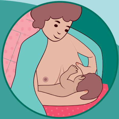
Posizione a culla modificata