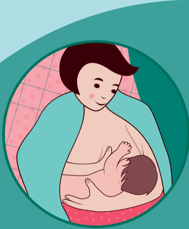
Posizione a culla